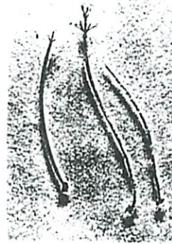
上図) 切断後の再生 (切断から約 60 時間後まで) 下図) カサノリの葉緑体分布 (左から均一、不均一、 バンドパターン)